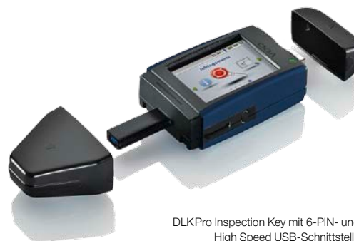
DLK Pro Inspection Key mit 6-PIN- und High Speed USB-Schnittstelle

Bestell-Nr. DLK Pro Neoprene Case: A2C59514917