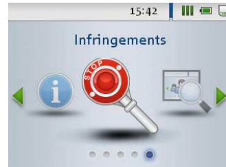
Verstoßkontrolle vor Ort